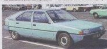
Tous les véhicules de plus de trente ans sont « de collection ».

La démarche pour faire obtenir la « collection » véhicule de collection dans la rubrique Z de la carte grise se fait dans une préfecture et ne coûte rien, mais elle est imbuvable. Ses avantages : la priorité du contrôle technique passe à cinq ans. Dans l'état de la législation, les véhicules de collection échappent aux restrictions de circulation et à la vignette antipollution. Enfin, surtout, considérés comme éléments de patrimoine, ils ne peuvent pas être considérés comme économiquement impropres à la suite d'un accident. Plus anecdotique, la carte grise collection autorise à circuler avec des plaques