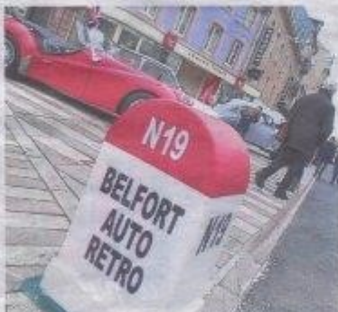
Le seul club de collectionneurs du Territoire de Belfort se réjouit de cette journée dédiée aux véhicules d'époque.