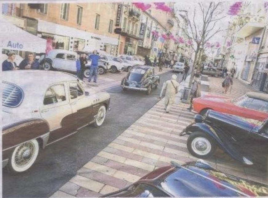
Le 26 mars, les vieilles carrosseries ont rendez-vous dans le faubourg de France de 10 h à 12 h. Une exposition mensuelle à l'initiative du Belfort Auto Rétro.

26 mars, premier rassemblement de voitures anciennes, de 10 h à 12 h faubourg de France. Et ce le dernier dimanche de chaque mois jusqu'à la fin novembre.