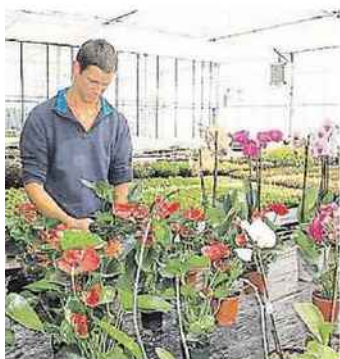
Restauration sur place. Gratuit.

Rendez-vous est donné, samedi, pour une journée dédiée au jardinage. Des bénévoles animeront un troc aux plantes et au petit matériel, de 10 h à 13 h. Les agents des espaces verts expliqueront leur travail et donneront des conseils pratiques. À suivre aussi, des ateliers sur le repotage et l'impression végétale. Des points d'informations et des espaces découverts enrichiront le programme.