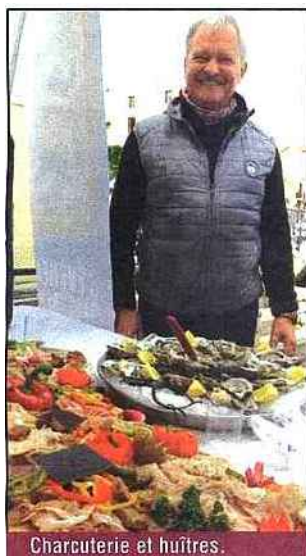
Charcuterie et huîtres.