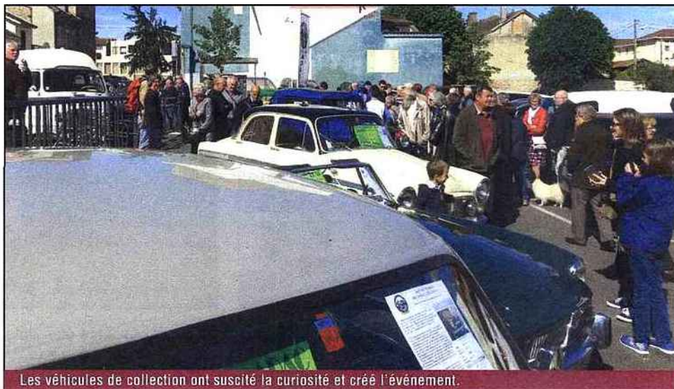
Les véhicules de collection ont suscité la curiosité et créé l'événement.