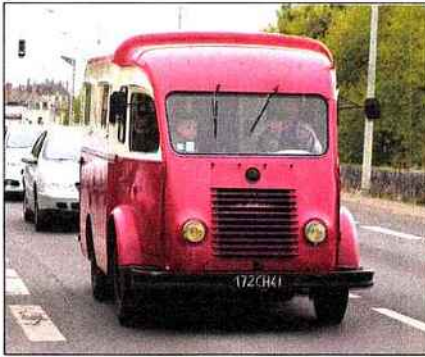
▲ Les utilitaires étaient aussi les bienvenus pour cette journée le long de la Loire. Ici, le passage d'un Renault 1 000 kg.