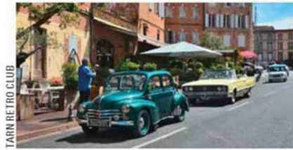
TARN RETRO CLUB

Autre option, si la météo n'est pas au rendez-vous : aller voir Taxi 5... Ou pas.