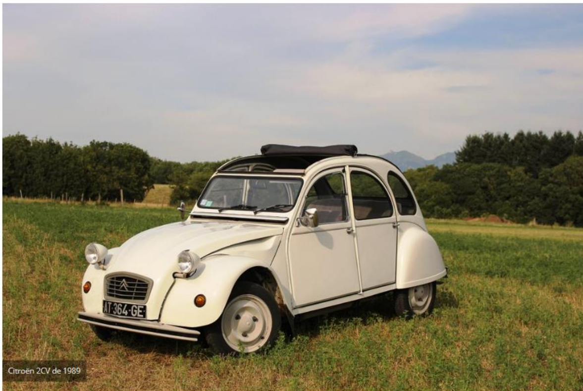
Citroën 2CV de 1989